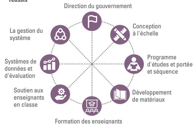
FIGURE 2. Programmes pédagogiques récents, à grande échelle et structurés dans les pays à revenu faible et intermédiaire avec des preuves rigoureuses d'impact